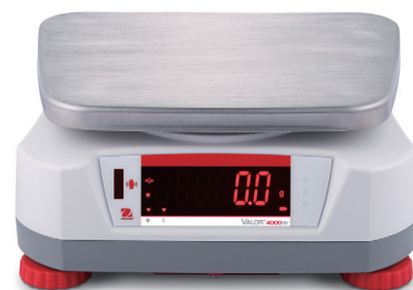
Zadní displej s dotykovým senzorem